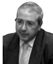
Jean-Paul Huchon, président du conseil régional d'Île-de-France

«Parce que ne rien faire c'est laisser faire, la Région a créé Jeunes Violences Ecoute , un outil à la disposition de tous ceux qui veulent en finir avec la violence».